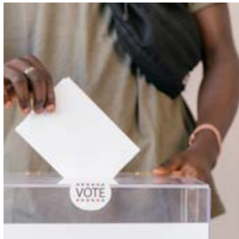
Elecciones sin Discriminación