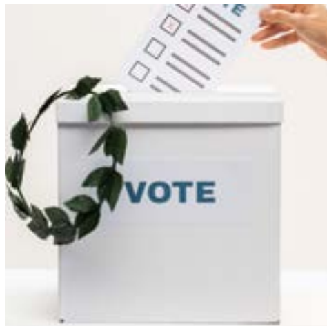
Elecciones sin Discriminación